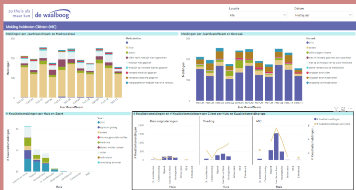
Fig. 3: weergave BI-tool De Waalboog